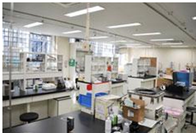
Lab III (バイオ・ソフトマター) (B403)