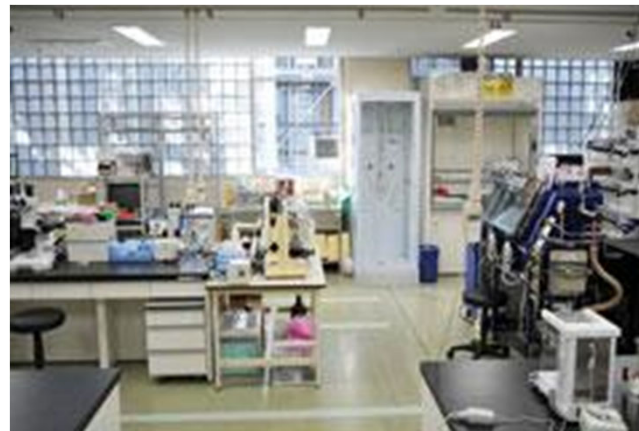
Lab II (ハードマター) (B402)