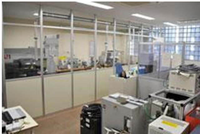
Lab I (試料加工) (B401)